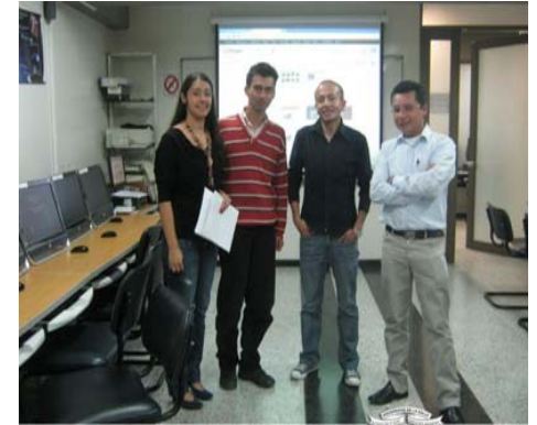
Programa de capacitación a Bibliotecas Comunitarias Universidad La Salle - 1º Semestre del 2013 TEMA: Crear un Blog