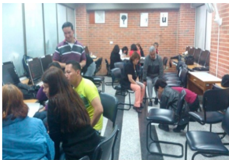
Programa de capacitación a Bibliotecas Comunitarias Universidad La Salle - 1º Semestre del 2013 TEMA: Mapas Visuales