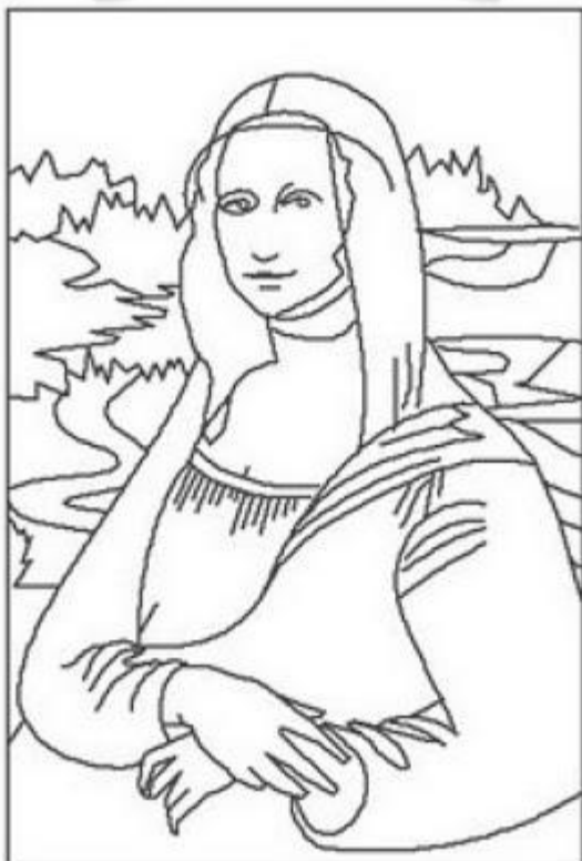
Leonardo da Vinci 1503-1506 Museo del Louvre, París